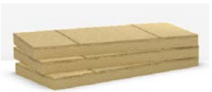
>> Hardrock Energy Plus