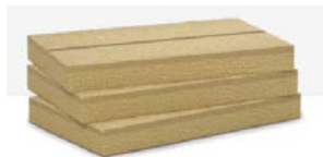
>> Frontrock Extra