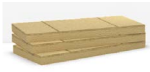
>> Durock Energy Plus