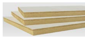
>> Flatrock 50 Bond