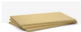
>> Frontrock (RP-PT)