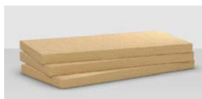
>> Fitrock Energy Plus - 234