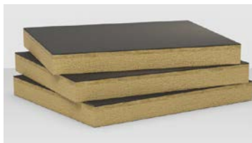
>>Rockacier B Soudable/Rockacier B Soudable Energy