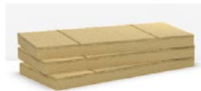
>> Flatrock 60