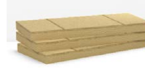
>> Flatrock 70