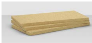
>> Pannello 220